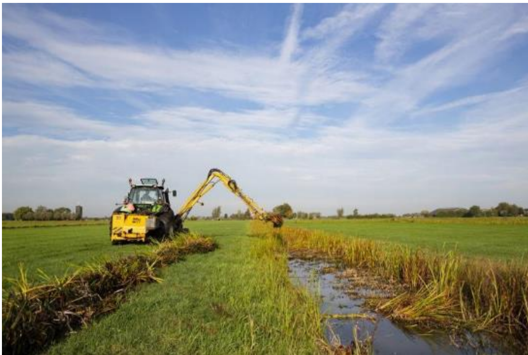
Ecologisch slootschonen

Baggerspuiten is bedoeld om delen van de sloot op diepte te houden. In dit beheerpakket moet dat met de baggerpomp, niet met de maaikorf, omdat dan de bodemvegetatie te veel beschadigd wordt.